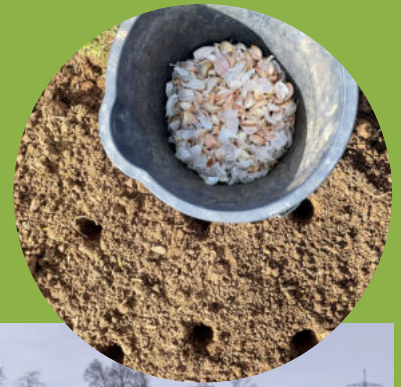
Eindrücke vom Arbeitseinsatz am 28.3.